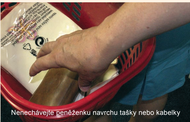
Nenechávejte peněženku navrchu tašky nebo kabelky