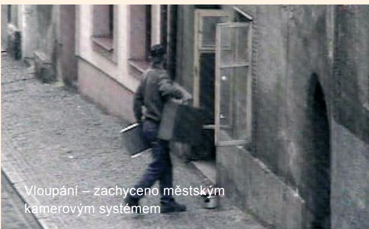
Vloupání – zachyceno městským kamerovým systémem